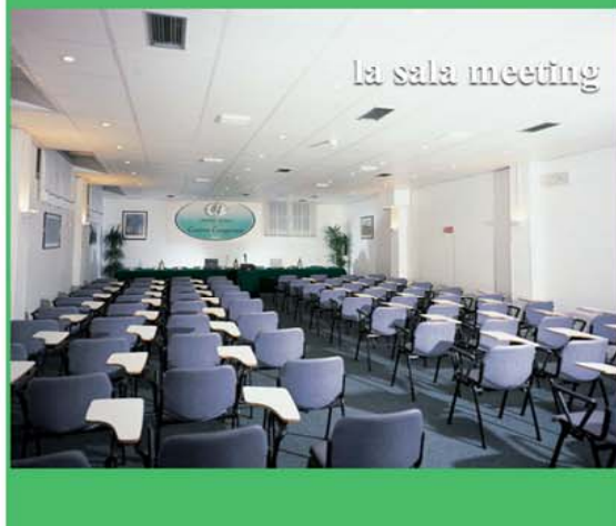
la sala meeting